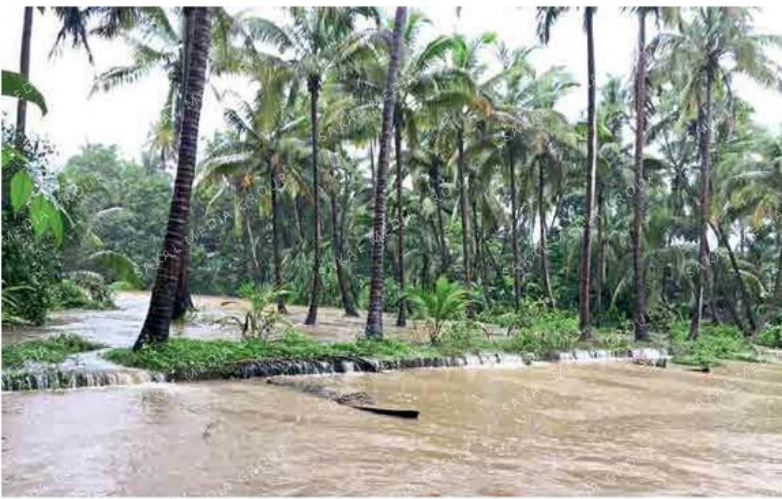
माजगाव (जि. सिंधुदुर्ग) : मुसळधार पावसाने ओहळ तुडुंब भरून वाहत होते.