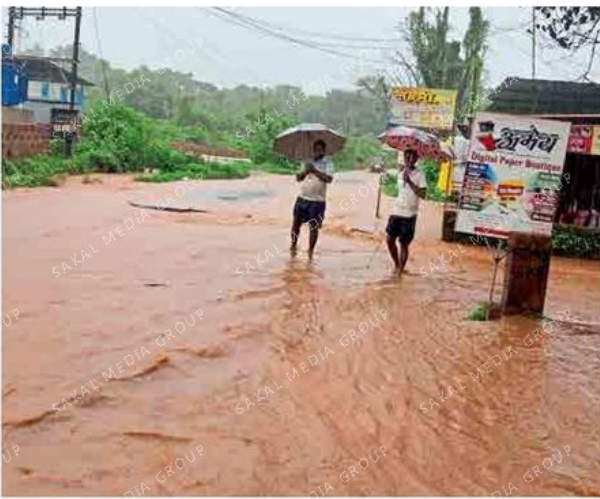
बांदा : येथे दोडामार्ग रस्ता पाण्याखाली गेला होता.