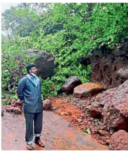
रत्नागिरी : हरचिरी येथे रस्त्यावर दरड कोसळली.